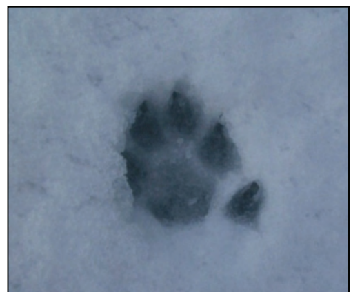
Fig. 27. Spor av lundehund i snø.