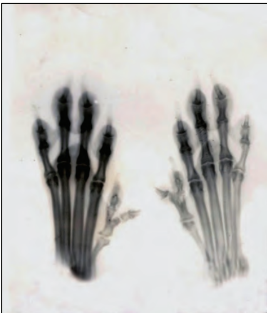
Fig. 34. Røntgenfoto av baklabber.