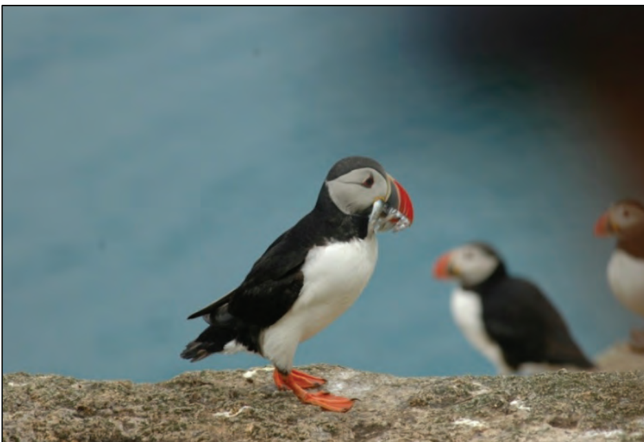
Fig. 12. Lundefugl med fisk (tobis) i nebbet. Den er på vei inn i reirhula for å mate ungene etter vellykket fangst på havet.