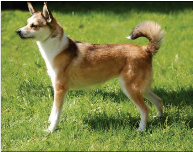
Fig. 28. Korrekt tisper, bemerk korrekt hale.