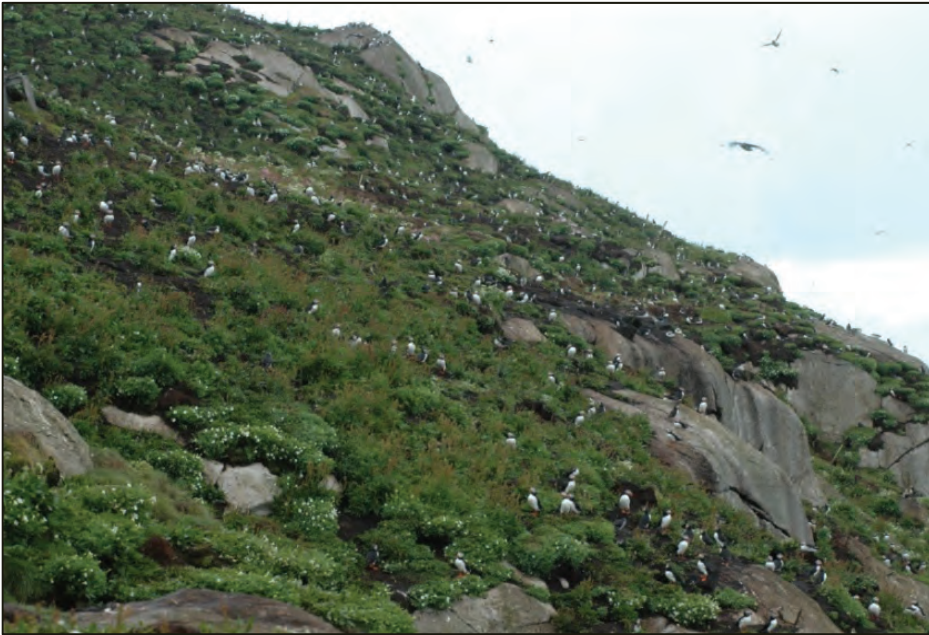
Fig 11. Lundefugler hekker i bratt ur. Fuglene er i dag utryddingstruet og fredet.