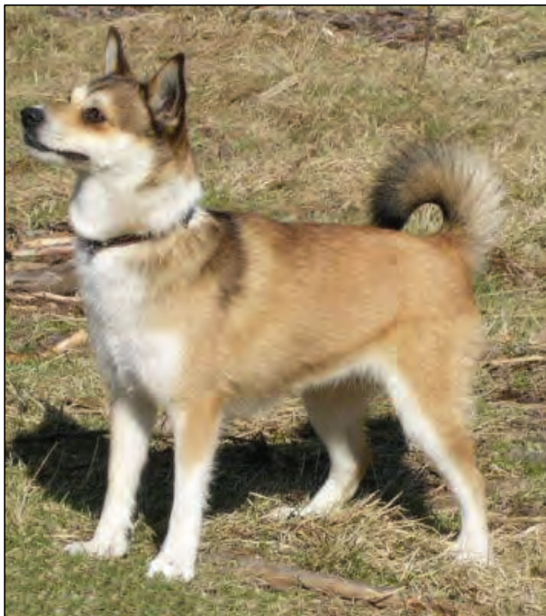
Fig. 14. Rasetyrisk tisper med gode proporsjoner. Bemerk: korrekt båret hale.