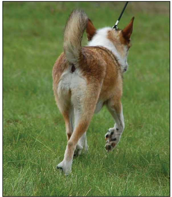
Fig. 38. Denne hunden beveger seg med korrekt trange bakbensbevegelser.