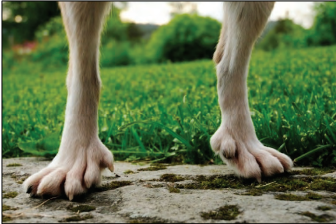
Fig. 32. Gode baklabber hvor femte tå inngår i støtteflaten på høyre bakken.