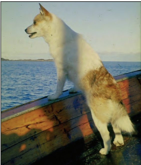
Fig. 39. Hvit og rød lundehund med fullt akseptable tegninger.