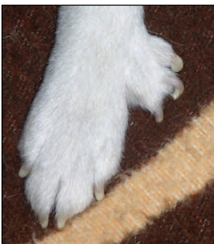
Fig. 26. Syv tær på forlabb regnes ikke som feil, men seks er mer ønskelig.