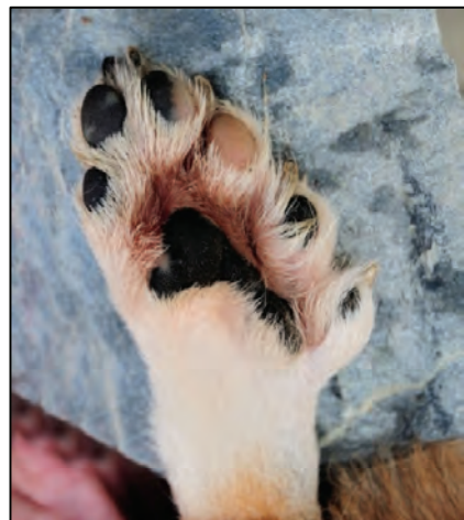
Fig. 35. Baklabb med velutviklede ekstratær