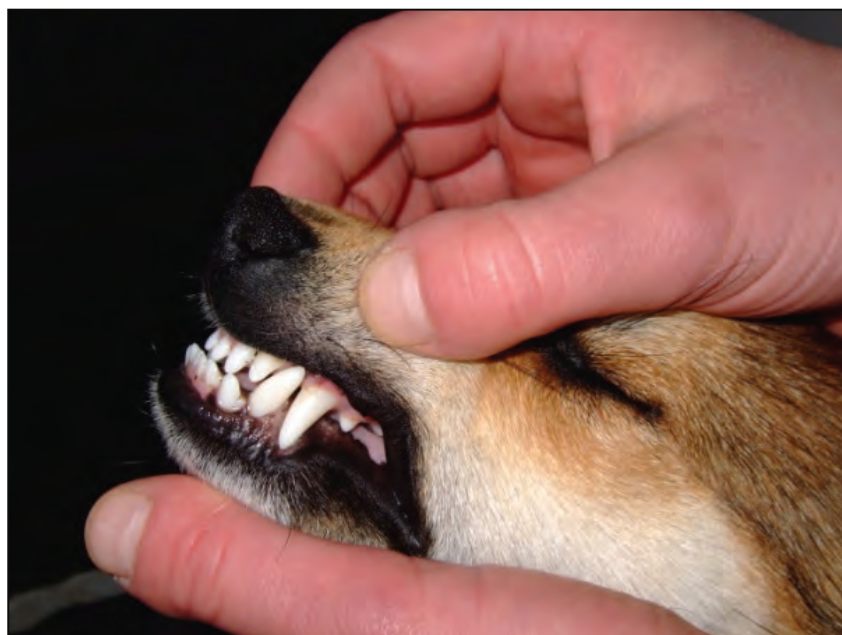
Fig. 18. Akseptabelt underbitt.