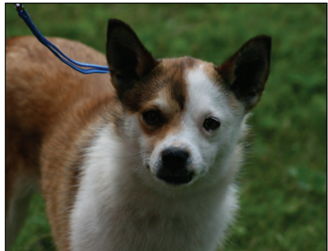
Fig. 40. Usymmetrisk tegnet hode. Trekkes en premiegrad.