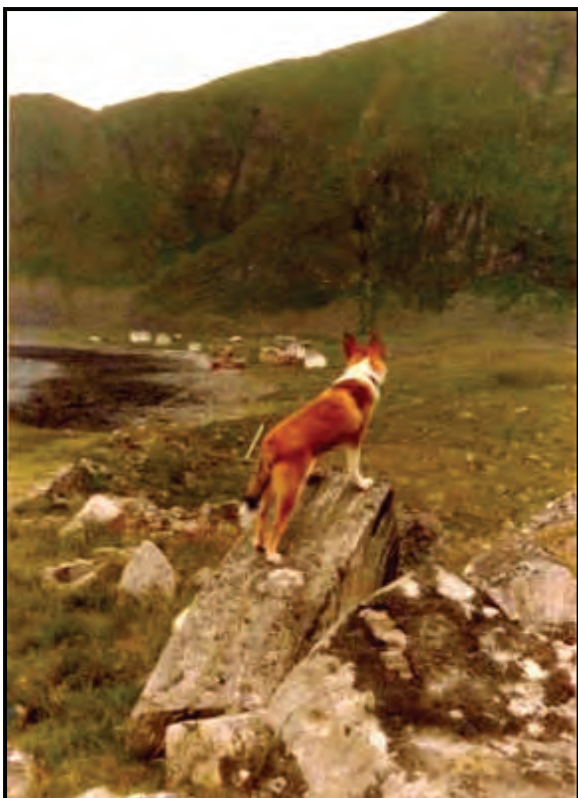
Fig. 5. Måstad ca. 1983.