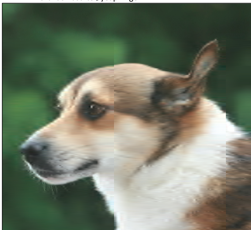
Fig. 21. Øre brettet. Lundehunden kan brette ørene i ulike vinkler for å beskytte øregangene mot jord når de kryper i lundefuglens reirganger.