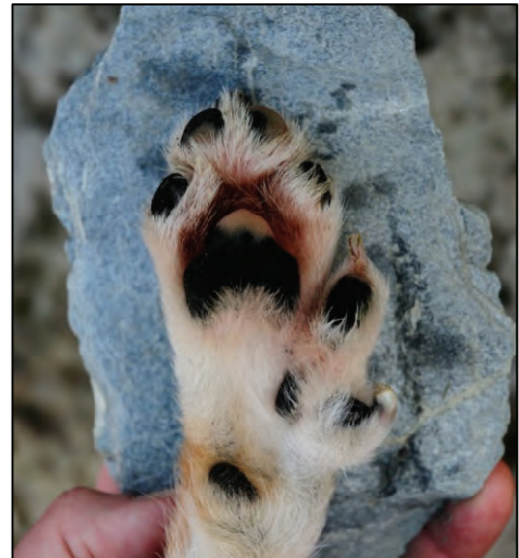
Fig. 25. Forlabb med velutviklede ekstratær.