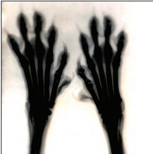
Fig. 24. Røntgenfoto av forlabber.