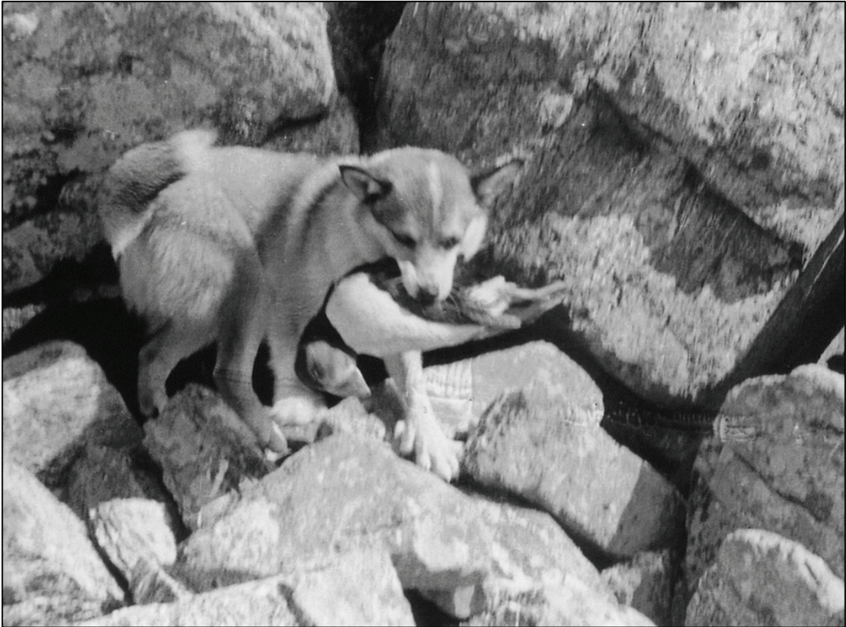
Fig.3 og 4. Lundehund utfører det den er spesialisert for: jakt på lundefugl i ura.