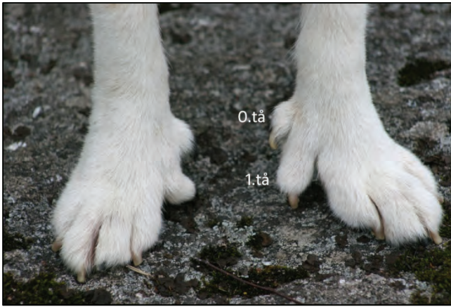
Fig. 22. Meget godt utviklede ekstratær, 0. tå og 1. tå er avmerket.