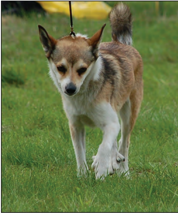
Fig. 37. Forbena beveges på en karakteristisk sveivende, roterende måte.