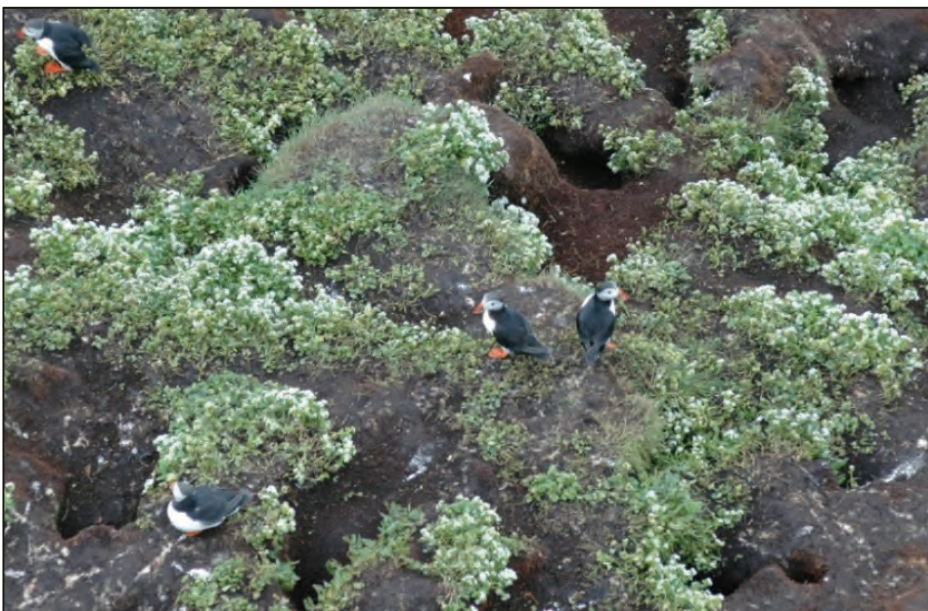
Fig. 13. Lundefuglen har reir i ganger som de graver ut i torva eller i huler i steinura.