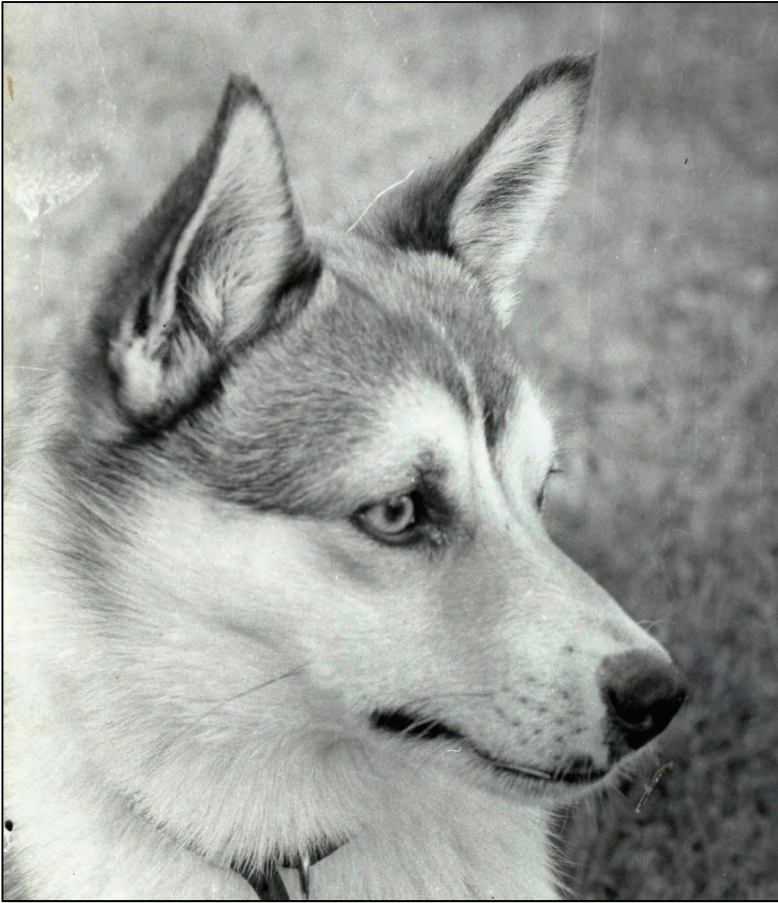
Fig.16. Maskulint hannhundhode. Bemerk også at hunden har korrekt øyenform og underkjeve, samt et våkent uttrykk.