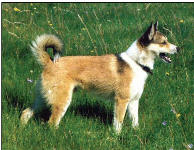
Fig. 15. Rasetyrisk hannhund med gode proporsjoner. Bemerk: korrekt båret hale.