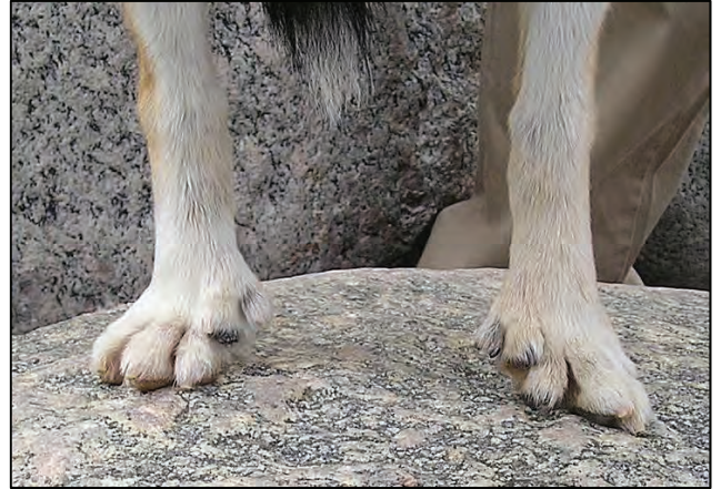
Fig. 33. Akseptable baklabber.