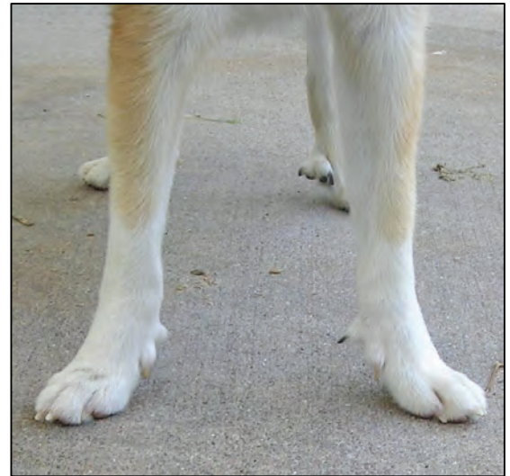
Fig. 23. Dårlig utviklede ekstratær, ikke CK-kvalitet.