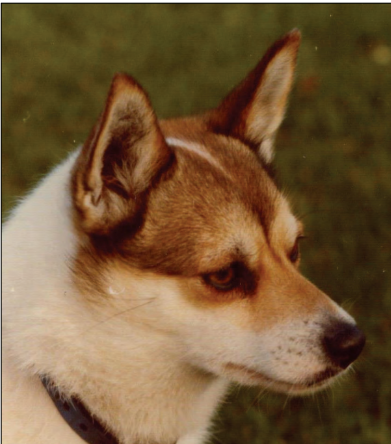
Fig. 17. Feminint, velskåret tisehode.