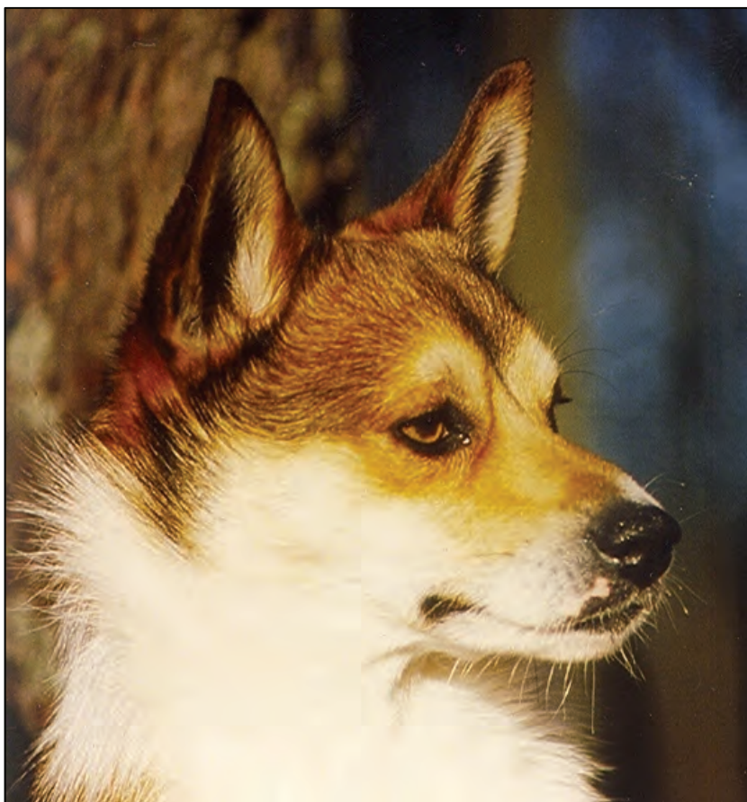
Fig. 20. Maskulint hannhund hode med korrekte, svakt skråstilte øyeåpninger.