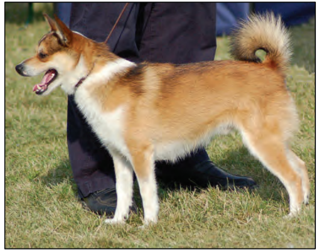
fig. 29. Korrekt hannhund, bemerk også gode proporsjoner og korrekt hale.