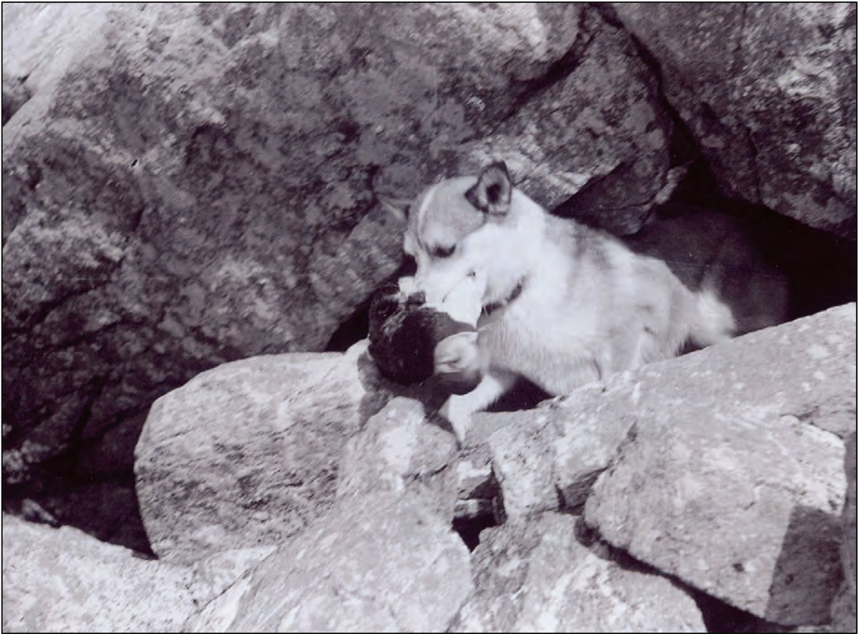
Fig. 10. Lunde hund jakter lundefugl i ura på Måstad. Bildet er tatt i 1972.